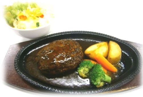
自家製ハンバーグ